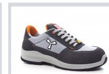
S1003 ACÉLSZÜRKE/VILÁGOS SZÜRKE