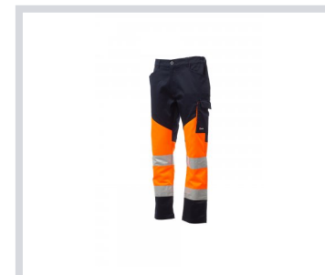
FLUORESZKÁLÓ NARANC SSÁRGA/TENGERÉSZKÉK